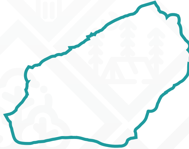
Zonguldak Sınır Çizgileri