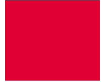
Pantone 199 C